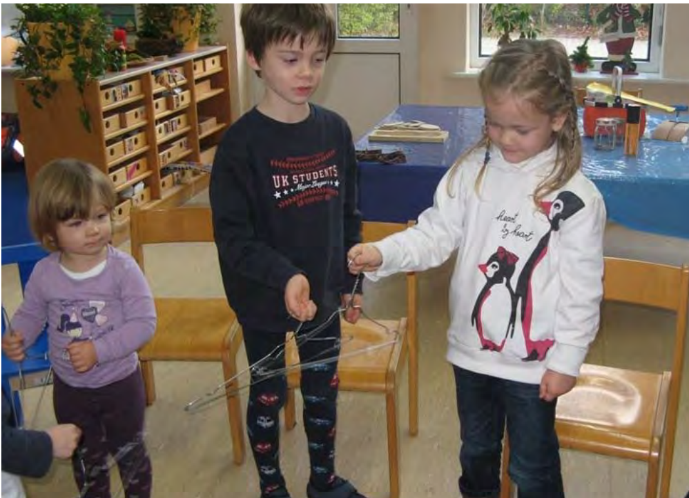
Auch Alltagsgegenstände können klingen und die Kinder faszinieren.

Die durch das Projekt geweckte Freude an der Musik und am Experimentieren mit musikalischen Ausdrucksformen wurde sowohl in der Kindertageseinrichtung als auch im Familienalltag hörbar, wenn beispielsweise neue Lieder spontan in Spielsituationen eingebunden