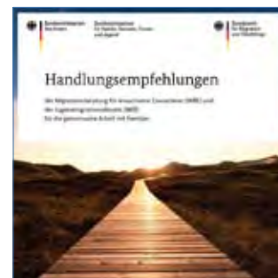
Bundesamt für Migration und Flüchtlinge (Hrsg.) 2013

Die Handlungsempfehlungen können Sie unter www.bamf.de > Willkommen in Deutschland > Information und Beratung > Beratung für Erwachsene herunterladen.