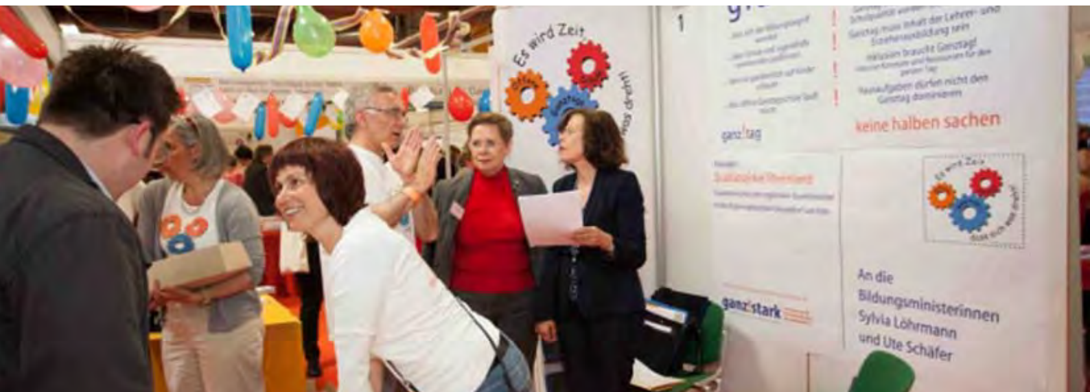
Am Stand konnten die Besucher ihre Wünsche für die Zukunft der OGS loswerden.