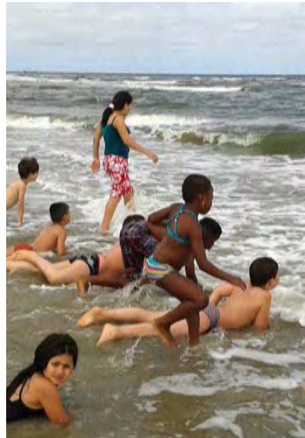
Elf Tage am Meer, für viele Familien der erste gemeinsame Urlaub.

Das Haus sauber zu halten, einzukaufen, das Frühstück zu servieren und das Abendessen zu kochen erledigten alle Jugendlichen und Erwachsenen arbeitsteilig gemeinsam. Schon beim Vorbereitungstreffen hatten wir mitgeteilt, die notwendigen Arbeiten nicht in Frauen- und Männertätigkeiten zu unterscheiden. Für einige Mädchen und Frauen war es dennoch neu zu sehen, dass Männer an der Spüle Teller reinigten oder mit dem Besen den Gemeinschaftsraum fegten. Einige Jungen mussten mit etwas Nachdruck davon überzeugt werden, dass auch sie zu putzen haben.