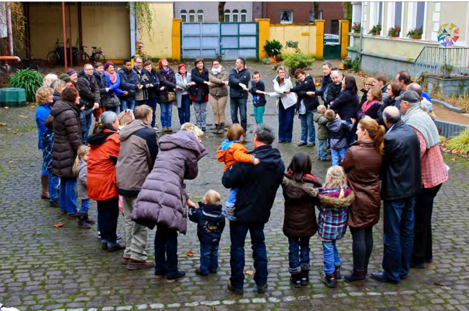
Am Familientag lernten sich alle mit Kind und Kegel kennen.

entsendet wurden. In den Pausen entstand ein reger Austausch, aus dem sich trägerübergreifende Netzwerke und Freundschaften entwickelten. Am Familientag lernten sich alle mit Kind und Kegel kennen. Nach dem Kolloquium, in dem unter den Augen der Fachberater in Kleingruppen ein Fachgespräch zu absolvieren waren, konnten alle die Teilnahmebescheinigung des Landschaftsverbands Rheinland und der Trägerkonferenz entgegennehmen.