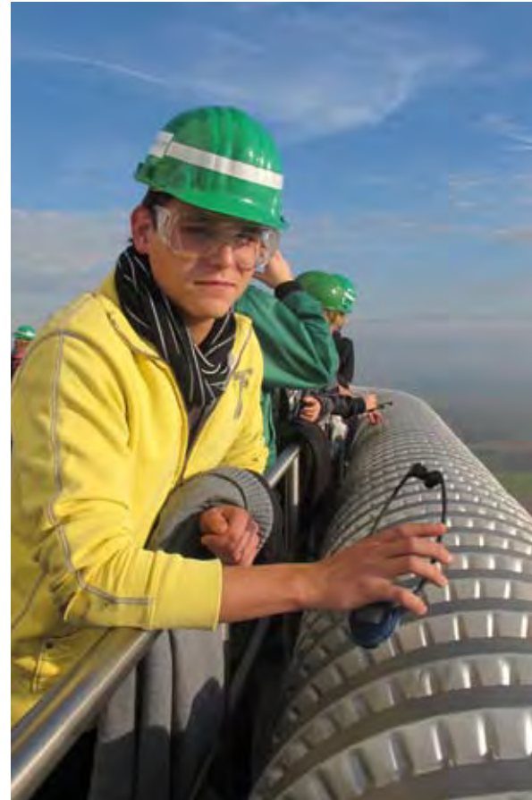
Energie aus Windkraft - Im FÖJ können die Freiwilligen ökologische Zusammenhänge und Verfahren erleben.

Mit der Verdopplung der Plätze ging auch eine Verdopplung der Stellen in der FÖJ-Zentralstelle einher. Neben der Seminararbeit und der Arbeit mit den Einsatzstellen begleiten fünf Hauptamtliche und eine Praktikantin im Berufseinmündungsjahr die Freiwilligen durch das Jahr und beraten sie bei Bedarf in beruflichen und privaten Angelegenheiten. Unterstützend arbeiten insgesamt zehn Teamerinnen und Teamer mit den Hauptamtlichen zusammen, sodass immer drei Betreuende im Seminar die hohe Qualität der Seminare gewährleisten können.