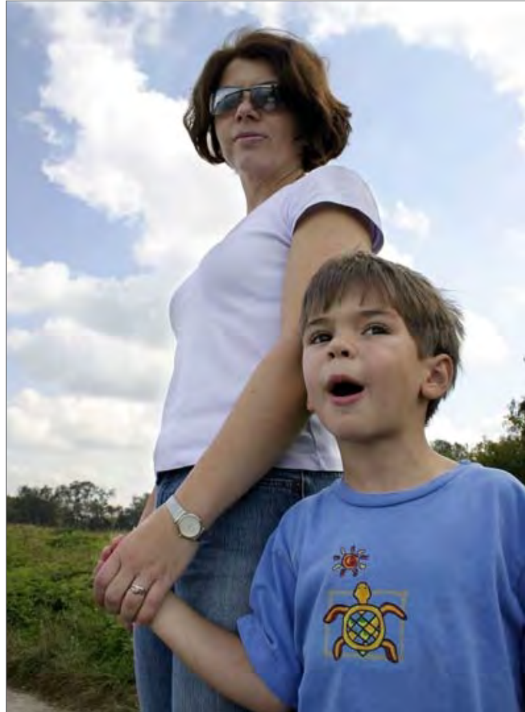
Die Aufnahme eines Kindes mit Behinderung ändert die gesamte Familiensituation.

Als besonders geeignet, bedarfsgerechte Unterstützungsangebote für behinderte Kinder in Familienpflege zu schaffen, bieten sich Erziehungsstellenträger an. Sie sind bestens spezialisiert auf die Beratung und Begleitung von Fachpflegestellen für Kinder und Jugendliche mit besonderem pädagogischem Bedarf. Die meisten Träger begleiten schon jetzt vereinzelt Kinder mit Behinderungen. Erziehungsstellenträger, die beabsichtigen, einen speziellen Vermittlungsdienst für Kinder mit Behinderungen zu entwickeln, müssen ihr Hilfeangebot neu ausrichten. Hierzu gehören: Personalausweitung, Fort- und Weiterbildung der Teams zur Aneignung der erforderlich Fachkompetenzen und eines Grundwissens in allen Bereichen der Behindertenhilfe. Zu empfehlen ist ein multiprofessionelles Team, beziehungsweise die interdisziplinäre Zusammenarbeit mit Experten wie Medizinerinnen und Medizinern, Pflegefachkräften, Heilpädagoginnen und Heilpädagogen, Refahfachberaterinnen und Refahfachberatern, Psychologinnen und Psychologen, Therapeutinnen und Therapeuten, Juristinnen und Juristen sowie Trauerberaterinnen und Trauerberatern.