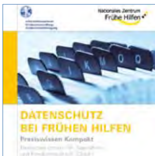
NZFH/IzKK (Hrsg.) 5. aktualisierte Auflage Köln 2013 ISBN 978-3-937707-81-5