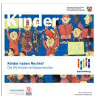
MFJKJS (Hrsg.) Düsseldorf 2013 Veröffentlichungs-Nr. 2043

Die Broschüre kann unter www.fruehehilfen.de > Materialien > Publikationen heruntergeladen oder bestellt werden.