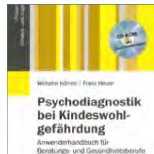
Beltz Juventa Weinheim, Basel 2014 148 Seiten ISBN 978-3779929130 16,95 Euro

Das Anliegen der Autoren ist es, die Erfassung von Kindesmisshandlung und -vernachlässigung im deutschsprachigen Raum im Interesse der vermutlich betroffenen Kinder, ihrer Eltern und der Fachleute in allen Einrichtungen, die mit Kindern zu tun haben, zu verbessern.