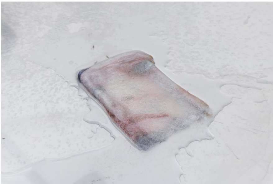
Abbildung 1: Alex Grein, Speicher, 2021, Courtesy die Künstlerin und Galerie Gisela Clement, Foto: Mareike Tocha