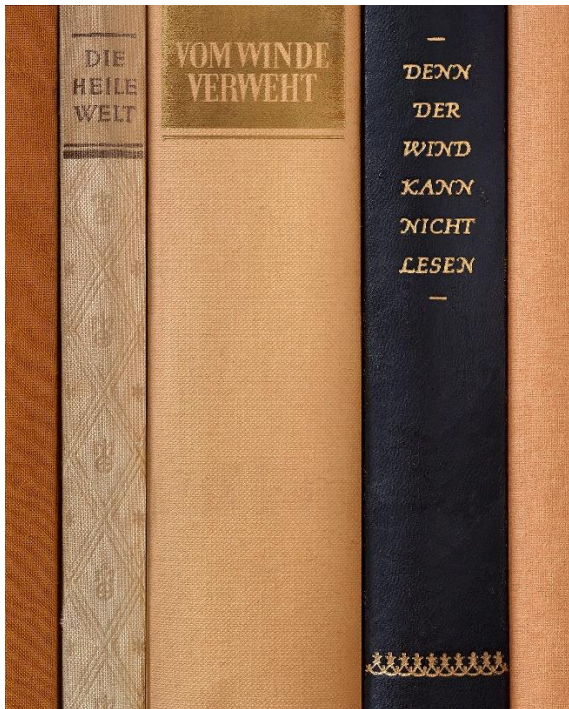
Abbildung 2: Alex Grein, Die heile Welt, vom Winde verweht, denn der Wind kann nicht lesen , 2020, Courtesy die Künstlerin und Galerie Gisela Clement