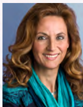
Ulrike Lubek Direktorin des Landschaftsverbandes Rheinland